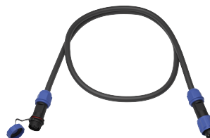
Удлинитель кабеля управления DMX, 1м. Арт.: LE-4036