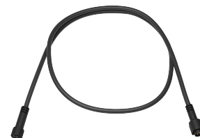
Удлинитель кабеля питания, 1м. Арт.: LE-4037